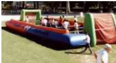
BABY FOOT HUMAIN 12 joueurs