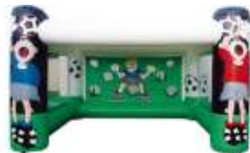
TIR AU BUT SOCCER