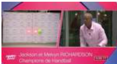
MUR NUMERIQUE FOOT INTERACTIF : l'Animation Tech Multiljeux Sports et O.I. !