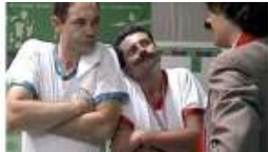
LES BRIGADES DU SPORT : la police au dernier stade