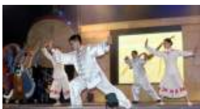
TAI-CHI-CHUAN : Animation Démonstration de l'Eternelle Jeunesse !