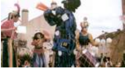
LES ECHASSIERS MUSICIENS : le théâtre des géants de la rue