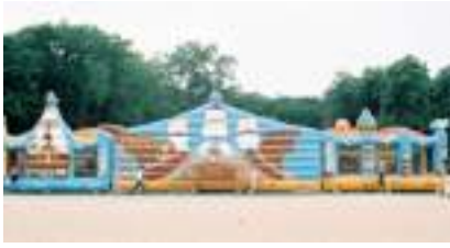
L'ÎLE AUX PIRATES GONFLABLE