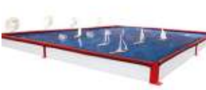
BASSIN DES VOILIERS : Petits Bateaux sur Plan d'Eau