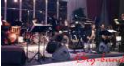
Orchestre BIG BAND FUNKY SOUL RNB

Published on Monica Médias ( https://www.monicamedias.com )