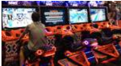
SIMULATEUR MOTO NEIGE à louer avec écran Vidéo géant !

Source URL: https://www.monicamedias.com/location-babyfoot-bonzini.html