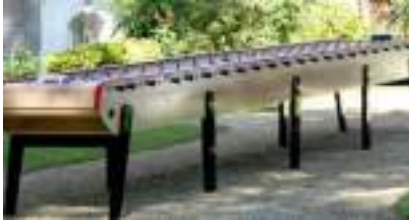
LOCATION BABY FOOT Géant Bonzini 22 JOUEURS