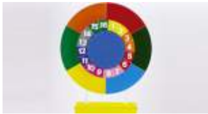
ROUE ELECTRONIQUE MULTICOLORE