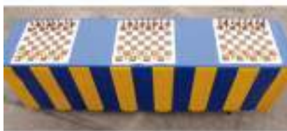
TABLE JEUX D'ECHECS

JEUX GEANTS Dames Mikado Puissance 4 : Stratégie et Adresse !