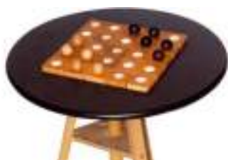
TABLE A ELASTIQUE