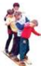
PLANCHES A SKI