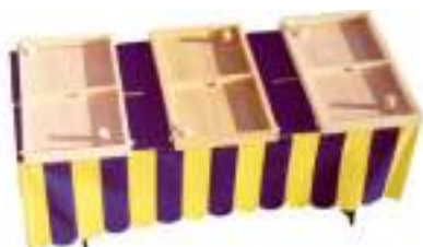
TABLE A ELASTIQUE