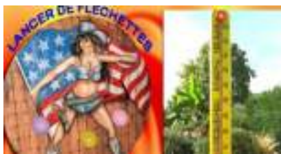
JEUX FORAINS : la JOURNEE des DEFIS !