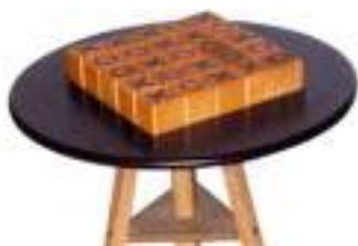
QUIXO CASSE-TETE STRATEGIE