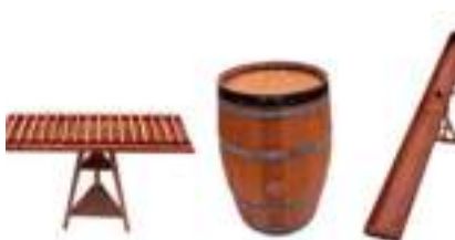
JEUX EN BOIS WESTERN