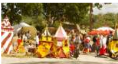
Le Petit Camp Médiéval des Beaux Jeux : LE VILLAGE DES CHERUBINS