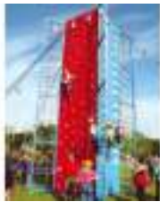
TOUR ESCALADE AVENTURE TYROLIENNE