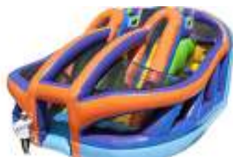
LE COMBO GONFLABLE de l'Ultime Parcours