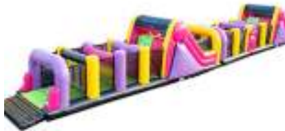
PARCOURS ENERGIE RUN GONFLABLE