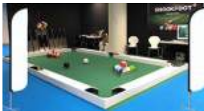
SNOOKBALL en location : le FOOTBALL comme sur un BILLARD, c'est SNOOKFOOT !