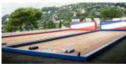
LOCATION TERRAIN DE PETANQUE ET BOULE