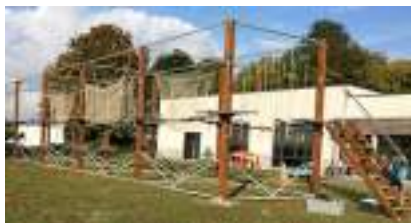
ACCROBRANCHE Parcours Escalade 12 ateliers