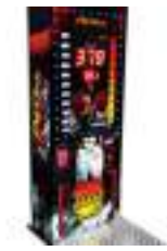
SIMULATEUR de BOXE : jeu de FORCE électronique