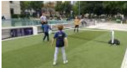
TENNIS BALLON : c'est de la Balle tout Foot !