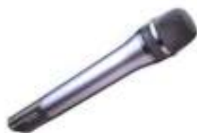
SONORISATION DE GRANDE SURFACE SONO SUPERMARCHE 5000 M2