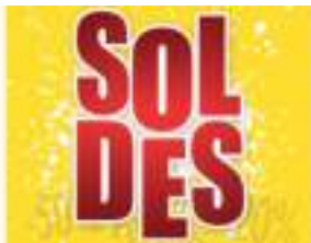
Tickets de tombola des Soldes