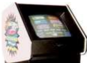
LOCATION BORNE JEUX VIDEO Arcade Vintage Années 80