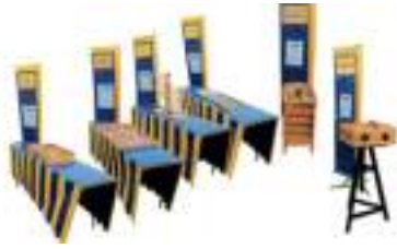
TOURNOI JEUX en BOIS PRESTIGE