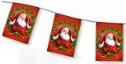
Guirlandes de Noël