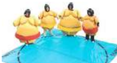
SUMO GONFLABLE ADULTE : le sport de lutte japonais en costume!