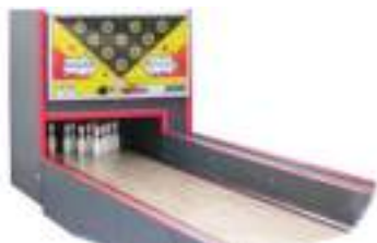
LOCATION PISTE de BOWLING américain

Published on Monica Médias ( https://www.monicamedias.com )