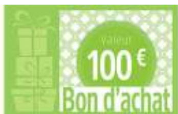
BON D'ACHAT DE 100 EUROS