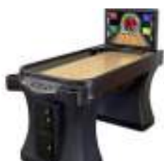
LOCATION SUPER SHUFFLE BOWLING électronique sur Table