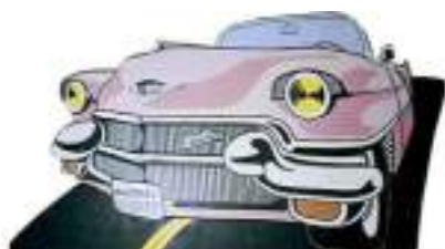
DECO ANNEES 60 SIXTIES USA 1 : Marilyn, JukeBox, Harley