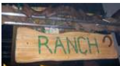
DECO WESTERN 2