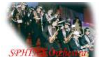
SPHINX ORCHESTRA: ORCHESTRE FUNK JAZZ BLUES SOUL BROTHERS