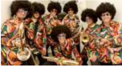
FANFARE DISCO FUNK : l'Orchestre Chic des Seventies