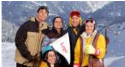
STUDIO PHOTO NEIGE SPORTS D'HIVER SKI MONTAGNE