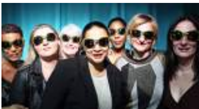
ANIMATION BORNE PHOTOCALL VINTAGE DISCO PHOTOBOOTH SUR FOND VERT