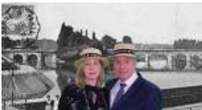
ANIMATION BORNE PHOTO RETRO Séniors 1900 PHOTOBOOTH sur fond vert