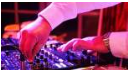
Dj sonorisé PRO pour fête dansante DISC JOCKEY international pour soirée entreprise

Source URL: https://www.monicamedias.com/animation-photo-disco-shooting-nightclub-studio-photocall-discotheque.html