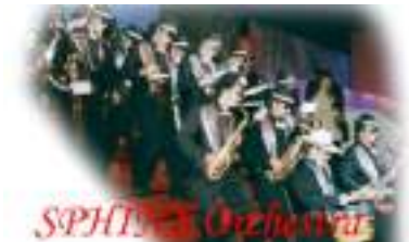
SPHIX ORCHESTRA: ORCHESTRE FUNK JAZZ BLUES SOUL BROTHERS