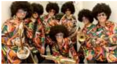
FANFARE DISCO FUNK : l'Orchestre Chic des Seventies