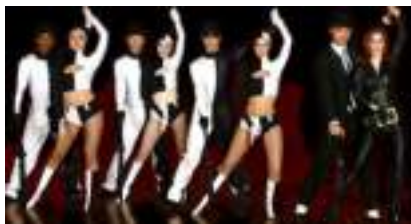
SHOW CUIR ET CHAPEAU MELON Fashion of London