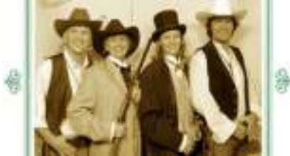
STUDIO PHOTO WESTERN FAR-WEST COW-BOYS