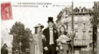
STUDIO PHOTO 1900 Rétro Belle Epoque Guinguette : le Photocall des Années Folles