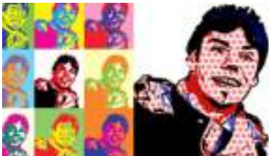
STUDIO PHOTO POP ART HOMMAGE ANDY WARHOL