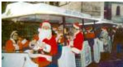
LE PETIT TRAIN ARTISTIQUE