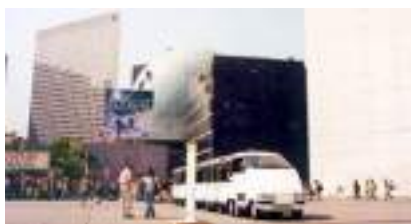
LE PETIT TRAIN PUBLICITAIRE