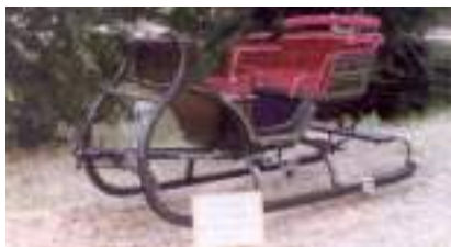
TRAINEAU DE NOEL 1905