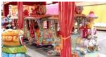
PETIT TRAIN sur RAIL de CONTES et LEGENDES