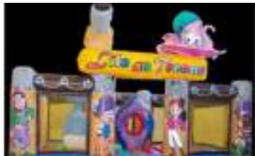
L'ILE DU POULPE AU TRESOR