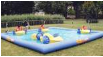
BATEAUX PADDLES : le Bassin Gonflable des Petits Pédalos du Mississippi