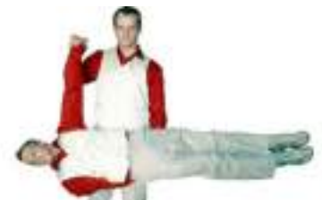
LE DUO QUI S'EXHIBE