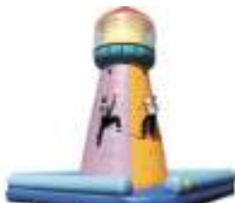
PHARE D'ESCALADE GONFLABLE