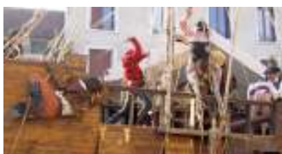
LES TERREURS DES MERS : Pirates sur la Ville