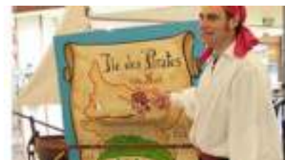
LE TRESOR DU PIRATE : chariot spectacle pour jeux d'aventure