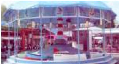
Manège des Petits Bateaux, du Phare et P'tits Mousses qui vont sur l'Eau...