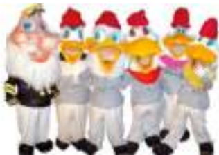
L'EQUIPAGE TOONS BD Bateau