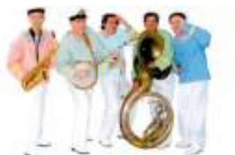
MARINS JAZZY MOUSSES