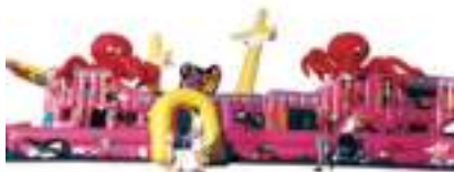
GRAND GALION GONFLABLE