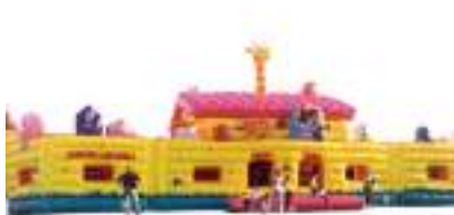
ARCHE DE NOE GONFLABLE