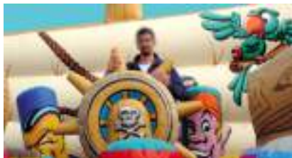
LES PIRATES DES CARAIBES