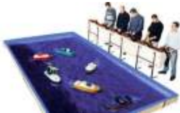
BASSIN pour BATEAUX RADIOCOMMANDES