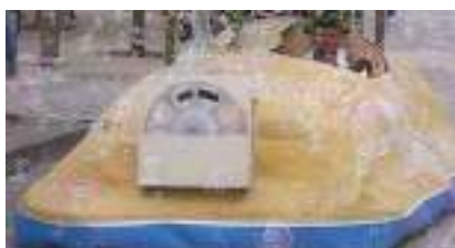
Char à Bulles sonorisé de l'Îlot des Pirates