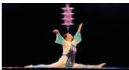
VERRES EN EQUILIBRE