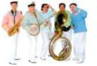
MARINS JAZZY MOUSSES