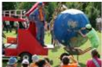
POINT D'EAU Planète Terre