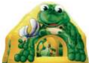
FROGGY LA GRENOUILLE