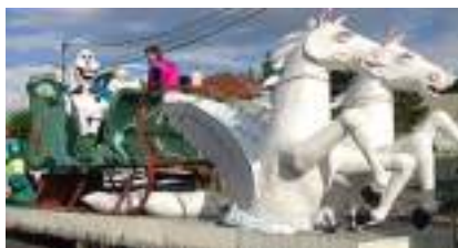
Char Lumineux des Chevaux Ailés et du Traîneau de Noël