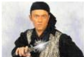
KRIS ROI du SABRE : équilibrisme de pointe et poignard