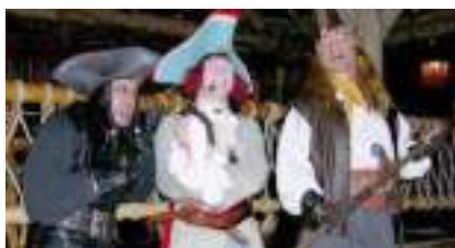
LA FLIBUSTE RIT