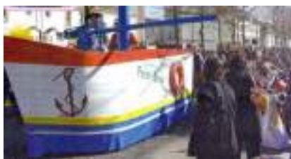
CHAR BATEAU CONFETTI PIRATE