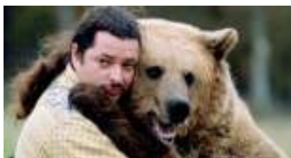
LA GRANDE OURSE du Dresseur Amoureuxdes Animaux