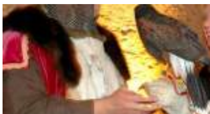
FAUCONNIER MAITRE DES RAPACES