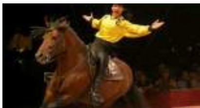
LES CAVALIERS KADHIKOV Acrobatie à Cheval