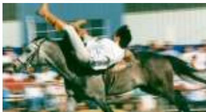
LA LEGENDE DU CHEVAL Cavaliers Voltigeurs