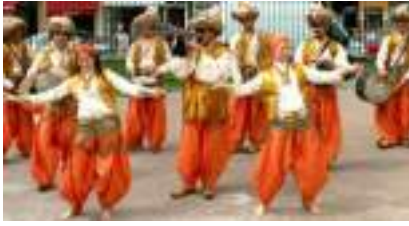
SIYARA : orchestre oriental d'Arabie