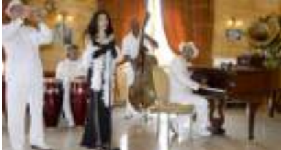
SOIREE CUBAINE CUBA LIBRE: SPECTACLE SALSA JAZZ LATINO