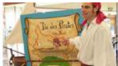
LE TRESOR DU PIRATE : chariot spectacle pour jeux d'aventure