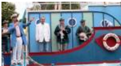
LE BATEAU DES VILLES : Théâtre de l'Eau