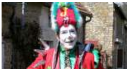
Le MIME CLOWN et sa MARIONNETTE magique en triporteur musical

Source URL: https://www.monicamedias.com/mecanique-et-bulles-machine-infernale-sur-char-velo.html