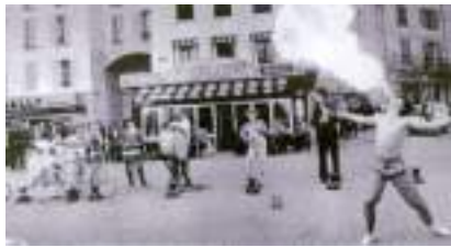
Cirque à vélo et monocycle : LES CYCLOWNS