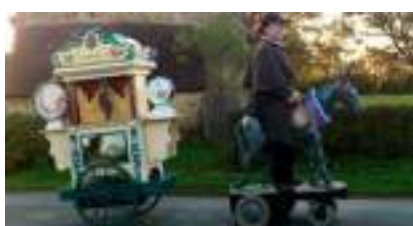
LE CARROUSEL LIBERE : suivez ce manège

Source URL: https://www.monicamedias.com/mecanique-et-bulles-machine-infernale-sur-char-velo.html