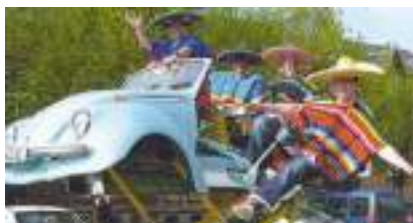
VOITURE CHAR : la Pitchoune Mexicaine