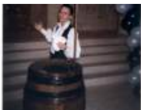
CAPITAINE MAGIQUE et son tonneau: cartes atout coeur de pirate!