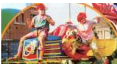
CHAR TURBO CLOWN : moteur musical pour carnaval