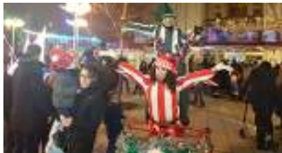
LE TRIPORTEUR LUMINEUX DES LUTINS DE NOËL