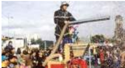
CHAR DES POMPIERS CONFETTIS