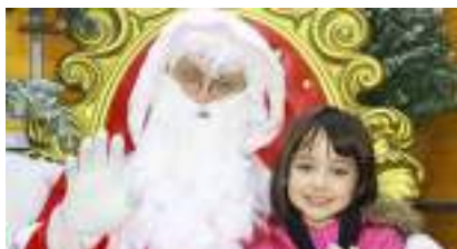
ANIMATION PHOTO PERE NOËL BORNE PHOTOBOOTH TRÔNE ET SAPIN