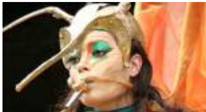
LES INSECTES Echassiers Multicolores