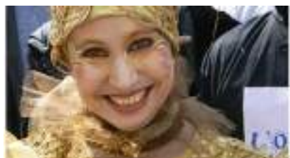
Les Gourmandes 4 Etoiles en Or sur Echasses en Mode Féerie et Gastronomie