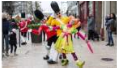
Les SOLDATS JOUETS de NOËL en Parade sur la Rue de la Paix ( et de l'Amour ) !