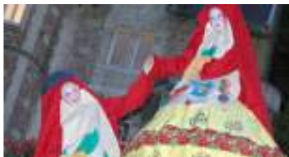
LES POUPEES RUSSES : matriochkas sur échasses