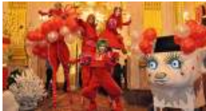
LES ECHASSIERS LUTINS ROUGES : la Fête Contemporaine Arty et Design