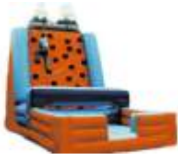
MONTAGNE D'ESCALADE GONFLABLE