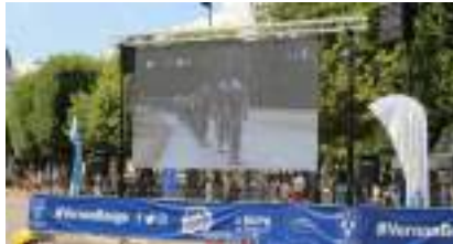
ECRAN GEANT LED HD OUTDOOR pour J.O., Coupe du Monde, Euro Football, Champions Sportifs et Grands Evénements

Source URL: https://www.monicamedias.com/le-parkour-l-art-de-se-deplacer-sans-laisser-de-trace.html