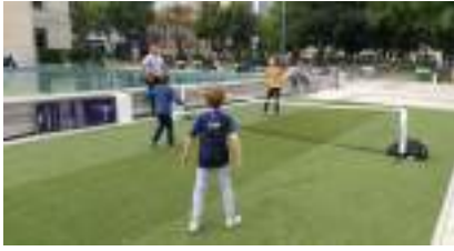
TENNIS BALLON : c'est de la Balle tout Foot !