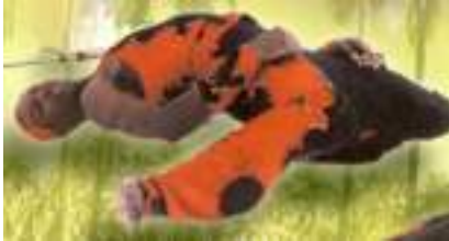
LIMBO STAR : DANSEUR ANTILLAIS POUR BARRE CREOLE