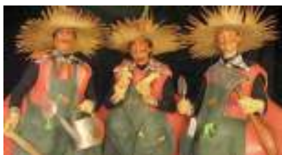
LES JARDINIERS CITROUILLES : sketches rires et nature