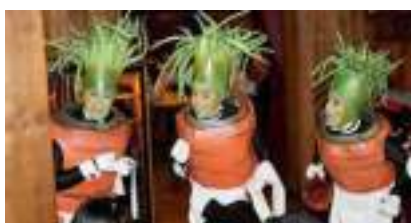
LES SERVEUSES CAROTTES : grosses légumes très organiques