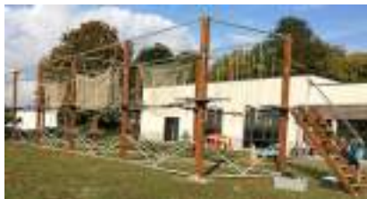
ACCROBRANCHE Parcours Escalade 12 ateliers