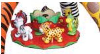
MANEGE GONFLABLE des ENFANTS de la JUNGLE