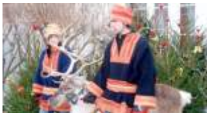
LES RENNES DE NOËL : le Traîneau direct de Laponie