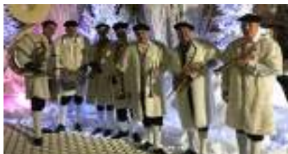
Orchestre des BERGERS MONTAGNARDS du NOËL en BLANC