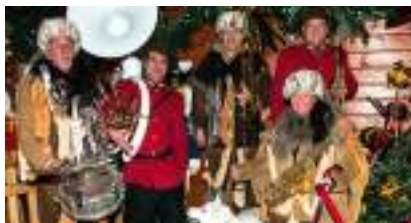
Orchestre du Grand Nord canadien LES TRAPPEURS