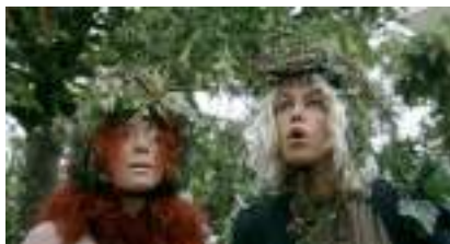
ECHASSIERS de la forêt : du Bio et Green 100% NATURE