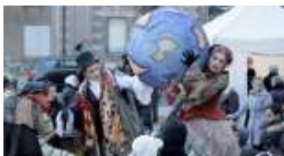
La Troupe des CONTEURS D'HISTOIRES de NOËL et ILLUSIONNISTES FEERIQUES