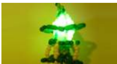
STAR LIGHTS : Luminaires en Ballons