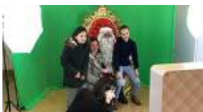
ANIMATION BORNE PHOTO PERE NOËL : Stand Photobooth sur Fond Vert