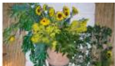
DECO PROVENCE 2