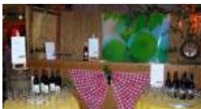
DECO PROVENCE 1