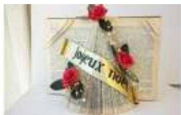
ATELIER DES LIVRES SAPINS