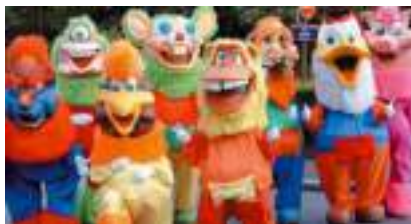
CARNAVAL TOONS BD