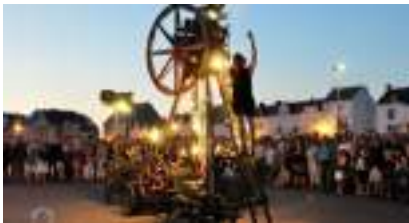
MECANIQUE ET BULLES : machine infernale sur char à vélo