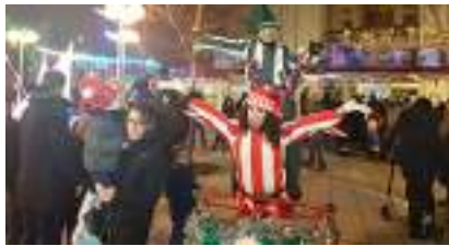
LE TRIPORTEUR LUMINEUX DES LUTINS DE NOËL