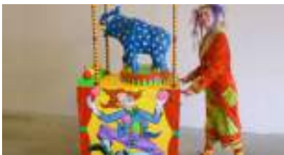
LA FETE AUX ENFANTS : la petite boutique ludique mobile