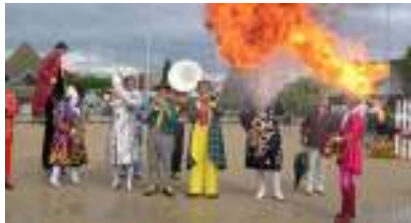
C'EST LA PARADE DU CIRQUE ! Jongleur Cracheur Clown et Monsieur Loyal...