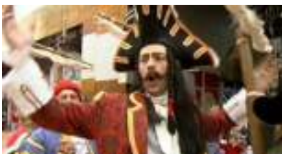
Comédiens Pirates et artistes improvisateurs des Mer : LES ECHOUES !

Source URL: https://www.monicamedias.com/solo-en-bicyclette-le-clown-vtt-musical-gags.html