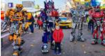
Les ROBOTS EXTRATERRESTRES PERFORMERS du Futur