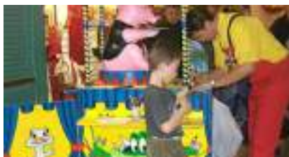
PROFESSEUR BRICOLAGE : atelier créateur de bonheur

Source URL: https://www.monicamedias.com/solo-en-bicyclette-le-clown-vtt-musical-gags.html