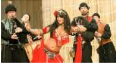
LES CHANTEURS JONGLEURS DANSEURS DU MOYEN AGE : le Temps des Cornemuses