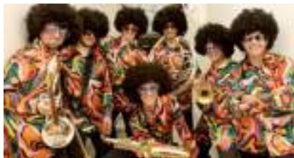
FANFARE DISCO FUNK : l'Orchestre Chic des Seventies