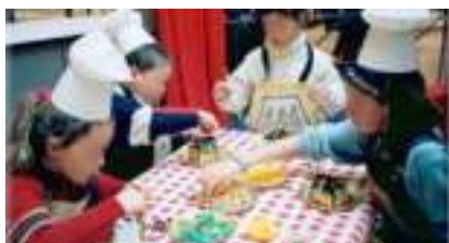
LA PETITE FABRIQUE : initiation petite enfance à la Création Manuelle