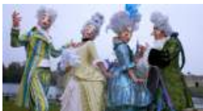
LES ECHASSES ARISTOCRATIQUES