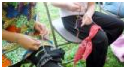
ATELIER BRACELETS BRESILIENS