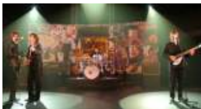
Orchestre NEW BEATLES : groupe dans le Vent REWIND