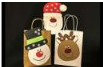
ATELIER SAC à CADEAUX de Noël