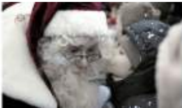
PERE NOEL et maxi LUTINS sur échasses