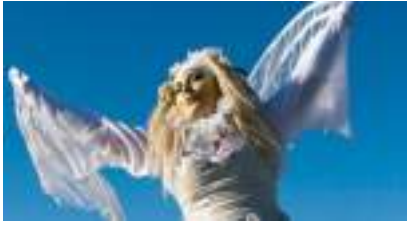
Blancs échassiers musicaux des neiges éternelles: LE PEUPLE DES MONTAGNES !