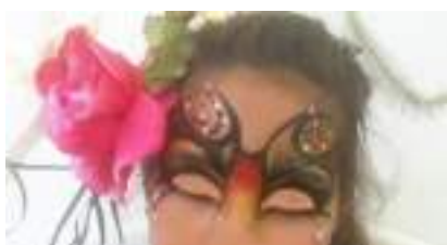
ATELIER COIFFURES VEGETALES : Cheveux en Fleurs