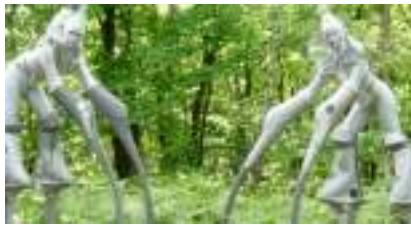
EXTRATERRESTRES GEANTS: échassiers insectes lumineux de science fiction