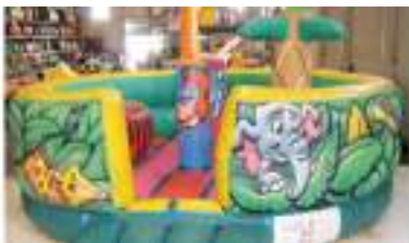
BABY JUNGLE GONFLABLE