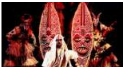
ECHASSES D'AFRIQUE: l'eau, le feu, la terre, les légendes se réveillent !