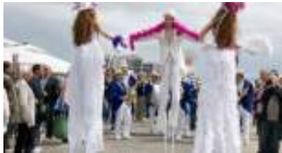
ECHASSIERS CABARET ANNEES FOLLES ET DANDY BELLE EPOQUE