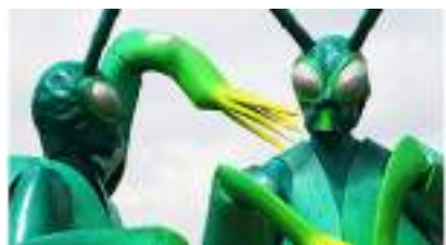
LES INSECTES LUMINEUX VERTS : Lucioles Géantes sur Echasses