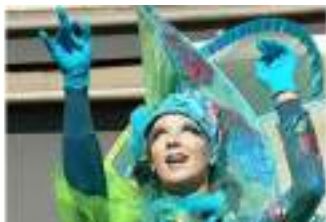
LES FLEURS SUR ECHASSES : Bouquet de Femmes Végétales au Parfum