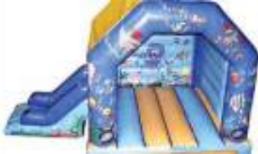
MER REMONTEE GONFLABLE