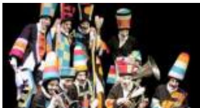
LES ECHASSIERS RIGOLOS : spectacle de rue en couleurs