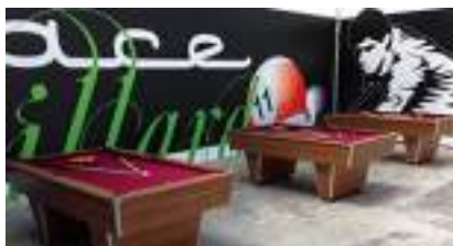
BEAUX BILLARDS DESIGN de LUXE en location