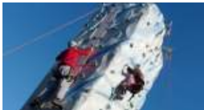
MUR DE GLACE