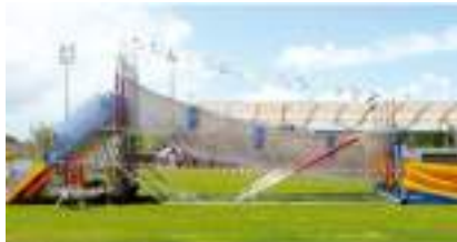
PARCOURS KIDS AVENTURE ESCALADE ET TYROLIENNE