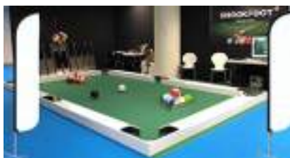
SNOOKBALL en location : le FOOTBALL comme sur un BILLARD, c'est SNOOKFOOT !