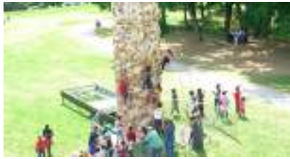
ROCHER MOBILE GEANT D'ESCALADE