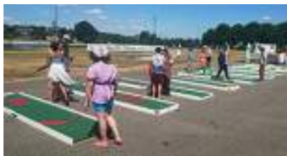
LOCATION MINI-GOLF : Parcours de Jeux 9 PISTES