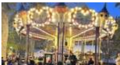
MANEGE CARROUSEL PAGNOL : la Gloire de mon Père, du Soleil et du Cinéma !