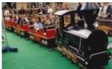
MANEGE PETIT TRAIN EXPRESS