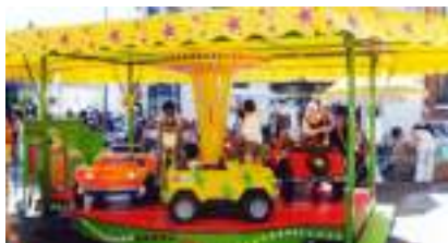
MANEGE DE POCHE : Roulez Jeunesse en Voiture Quad Moto