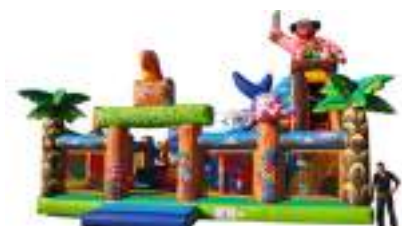
RODEO PIRATE sur REQUIN GONFLABLE