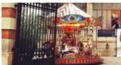
Le Petit Carrousel de Fête Foraine à Louer