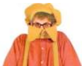
L'ENFANT GEANT ECHASSIER: le plus grand écolier du monde