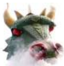
LES DRAGONS FUMEUX SUR ECHASSES