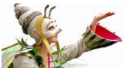
LES ECHASSIERS MINUSCULES: dans un Jardin Fantastique et Nature