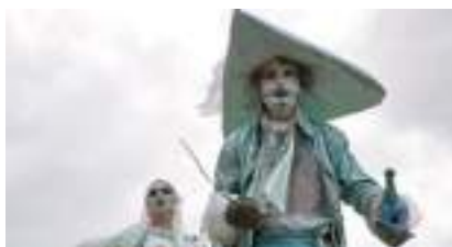
LES ECHASSIERS PIRATES des Mers et SIRENES des Coeurs