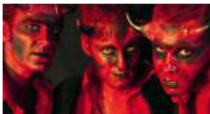
ECHASSES D'ENFER : péchés endiablés