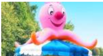
CARROUSEL DES CHAISES VOLANTES ET DE LA PIEUVRE du JAPON