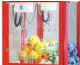
LOCATION GRUE FORAINE : Machine à Peluches et Cadeaux à Gogo !