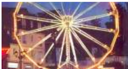
La Grande Roue du Paris Universel de 1900