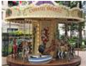
LE MANEGE CARROUSEL DU JARDIN DE BAGATELLE