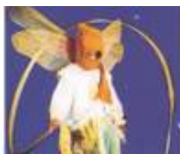
INSECTES GEANTS ECHASSIERS: ailes de lumières