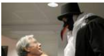
LES MANCHOTS DU PÔLE SUD : les échassiers en Noir et Blanc brisent la glace