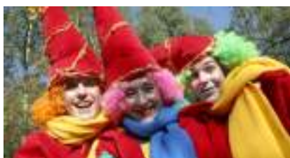
LES LUTINS DU PÈRE NOËL: les échassiers mettent le Paquet... Cadeau !