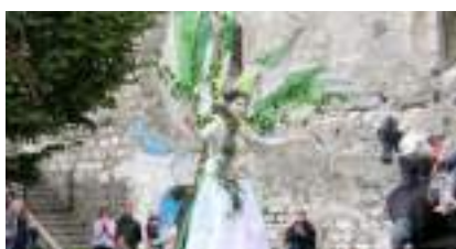
LA FÔRET EN ECHASSES: les esprits grandeur Nature