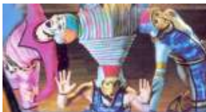
LES ECHASSIERS HIGH-TECH : le futur à pas de géants