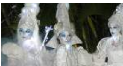
LES ECHASSIERS Blancs Lumineux Musiciens : la DIVA lyrique et le VIOLONISTE