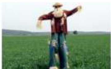
LES EPOUVANTABLES sur ECHASSES : la Drôle de Famille des EPOUVANTAILS des CAMPAGNES