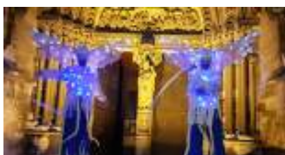
Les Insectes Blancs Lumineux sur Echasses