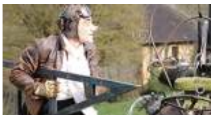
LES BOUFFONS VOLANTS : Echassiers du Cinéma et de l'Etrange