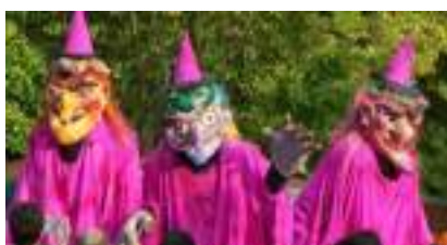
SORCIERES ECHASSIERES: cuisine d'enfer