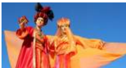
LES ECHASSIERS D'ORIENT: aventuriers du désert