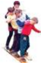
PLANCHES A SKI