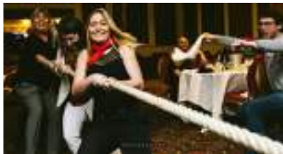
JEU DU TIR A LA CORDE