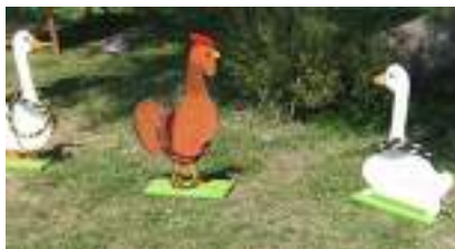
JEU DU LANCER D'ANNEAUX SUR ANIMAUX

Source URL: https://www.monicamedias.com/labyrinthe-en-bois-geant-grandeur-nature-le-dedale-sensoriel-pedagogique.html