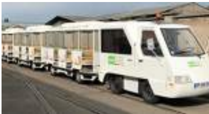
LE PETIT TRAIN ELECTRIQUE ROUTIER à louer : Ecologique et Touristique !