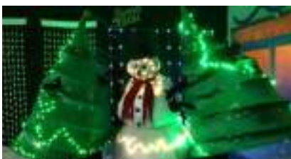
Le BONHOMME de NEIGE GEANT, ses SAPINS de NOEL et leurs Faits d'Hiver !