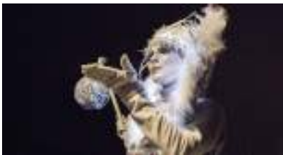
La Troupe du Cirque de Lumières du Noël en Blanc : Echassiers des Neiges et Jongleurs Artificiers!