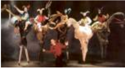
DIABLES SUR ECHASSES: l'Enfer est à vous