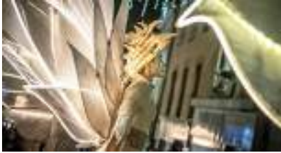
ECHASSIERS Blancs Lumineux Musicaux de Noël