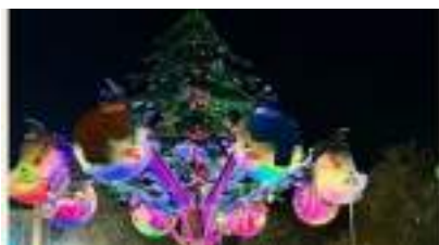
MANEGE du GRAND SAPIN DE NOEL en Location