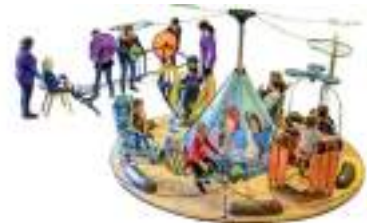
MANEGE ECOLO AVENTURE à pédales