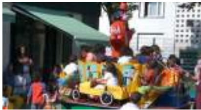
MANEGE ECOLO clown voitures et animaux