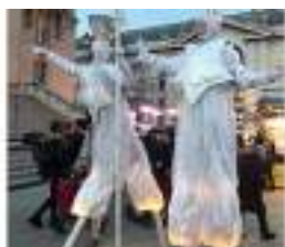
Les Etoiles Blanches Lumineuses de NOEL sur Echasses