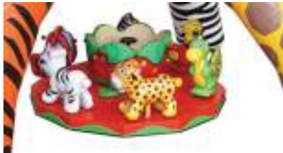
MANEGE GONFLABLE des ENFANTS de la JUNGLE