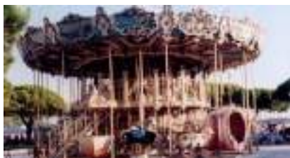
Carrousel géant 2 Etages : Manège Authentique de 1924