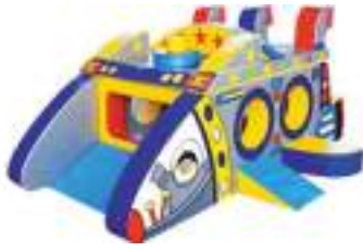
VAISSEAU ESPACE GONFLABLE Space Ship