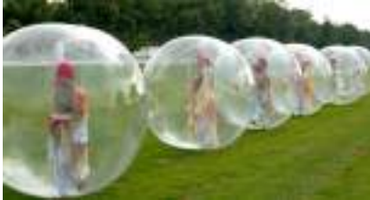
ARTISTES EN BULLES : danse et jonglerie aériennes

Source URL: https://www.monicamedias.com/robot-des-stars.html