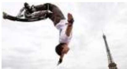
Echasses urbaines : un spectacle à faire des bonds de joie !