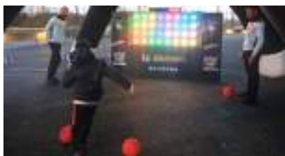
MUR DIGITAL FOOTBALL : l' Animation Multisports Numérique !