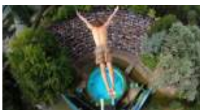
Plongeon aérien de haut vol : se plonger dans un spectacle extrême sans se mouiller!