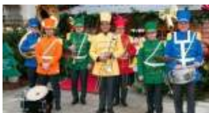
Grand Orchestre de Parade, Jazz-Band et Marches Américaines : CASSE NOISETTE