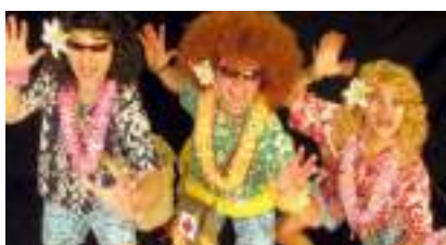
LES BEACH BROTHERS : soleil surf and sea de Polynésie