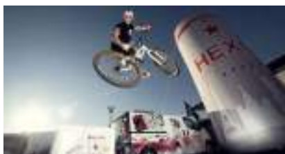
VTT Trial : le spectacle de vélo qui colle à la roue !