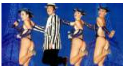
SPECTACLE CABARET PARIS Cancan Girls et Paillettes