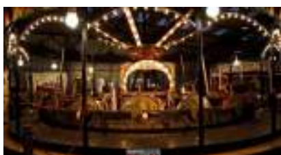
Le Manège Carrousel Vélocipède Authentique 1890