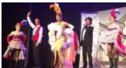
Spectacle Séniors : Le French CanCan en Comédie Musicale "LAURE DE PANAME"