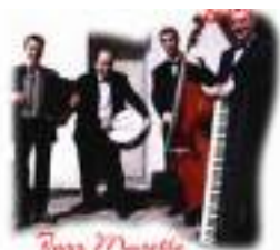
JAZZ MUSETTE Orchestre Chansons Accordéon