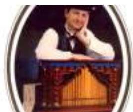
LE SAINT VALENTIN: ORGANISTE DE L'AMOUR