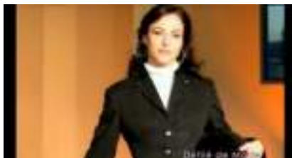
Organisation de Défilé de Mode FASHION STARS