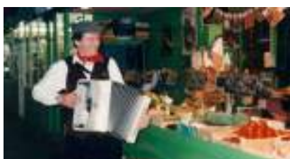
ACCORDEONISTE MUSETTE : Chansons Françaises Rétro Valses pour Bal à l'Ancienne