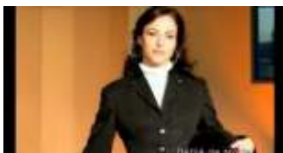
Organisation de Défilé de Mode FASHION STARS