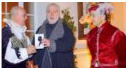
DOCTEUR SILHOUETTE: profil aux ciseaux