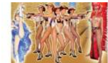
SOIREE SPECTACLE FAR WEST : CANCAN WESTERN