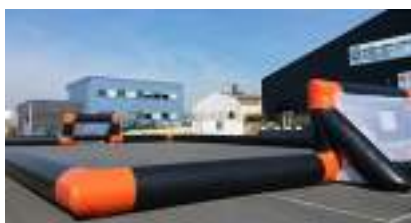
LOCATION TERRAIN FOOTBALL BEACH BUBBLE SOCCER Gonflable 5 vs 5