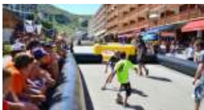
Street Foot dans votre rue : un Terrain et des Pros, plus qu'une animation football ou soccer !