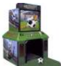
LOCATION JEU VIDEO TIR AU BUT FOOTBALL