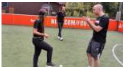
CECIFOOT ou Football à l'Aveugle : le Blind Foot réinvente les Sens !