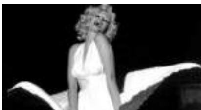
SOSIE MARILYN MONROE

Published on Monica Médias ( https://www.monicamedias.com )