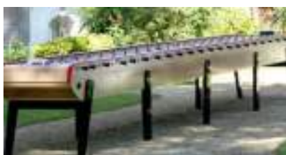
LOCATION BABY FOOT Géant Bonzini 22 JOUEURS