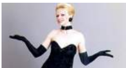
PIAF ET LE FOU CHANTANT: Hommage à la Môme et à Trénet