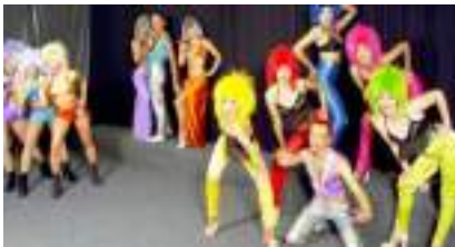
CHŒURS DE STARS : UN SIECLE DE REVUES AU MUSIC HALL