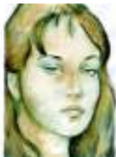
AQUARELLISTE EN COULEURS : peinture à l'eau