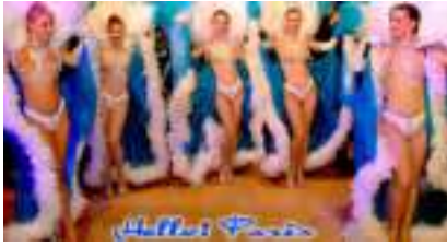
Soirée Spectacle Cabaret : Hello Paris French Cancan