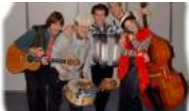
Orchestre Guinguette Musette Jazz Chansons Françaises : LES TITIS PARISIENS