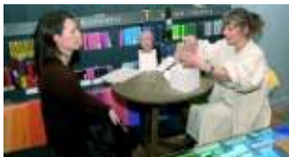
SCULPTEUR DE TÊTE: Art 3D