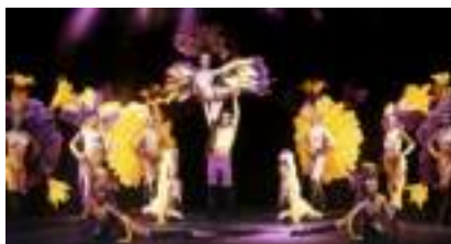
Soirée Cabaret Paradise : le Music Hall des 5 Continents