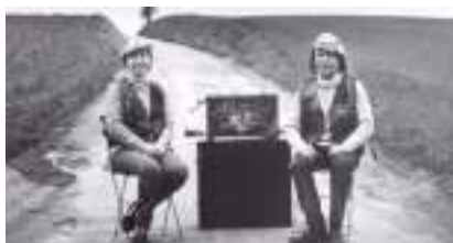
ORGUE 2 BARBARIE : Duo d'Amour pour animation 2 rue