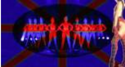
Soirée Cabaret Spectacle : Revue Paradise Paris