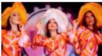
LA CITE DES ANGES : LES GRANDS SUCCES DU MUSIC-HALL