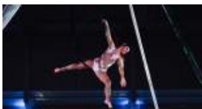
Spectacle Multisport Rêve de Jeux : le Show Freestyle Foot, Street Trial and Dance !