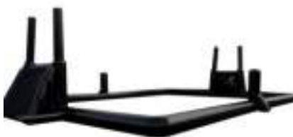
Terrain Multi Sport Football et Rugby : le beau Stade !