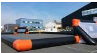
LOCATION TERRAIN FOOTBALL BEACH BUBBLE SOCCER Gonflable 5 vs 5