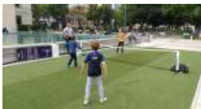
TENNIS BALLON : c'est de la Balle tout Foot !