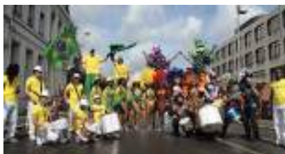
LES SUPPORTERS BRESILIENS : Echasses Capoeira et Samba Dance