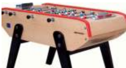
LOCATION BABYFOOT BONZINI