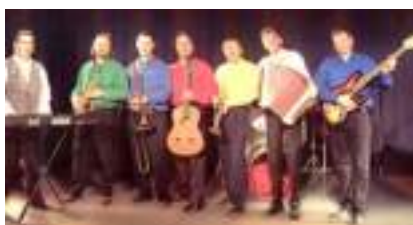
ORCHESTRE Variétés Rock Disco Musette Country