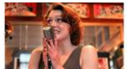
ORCHESTRE JAZZ vocal Cabaret B.B. 1