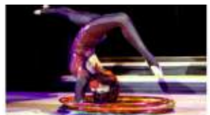
MISS HULA HOOP : cerceaux pour danse orientale ou sixties