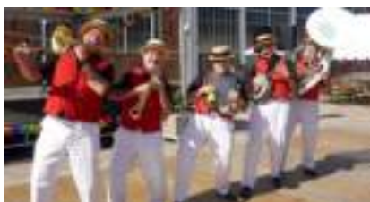
JAZZ NEW ORLEANS B.B.B. Orchestre de Parade Nouvelle-Orléans Swing