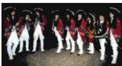
LES TAMBOURS DU ROI SOLEIL : les Marches de l'Armée de Louis XIV à l'Empire de Napoléon