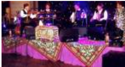
LES BERBERES Orchestre MM Kabyle Touareg