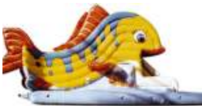
POISSON TROPICAL GONFLABLE