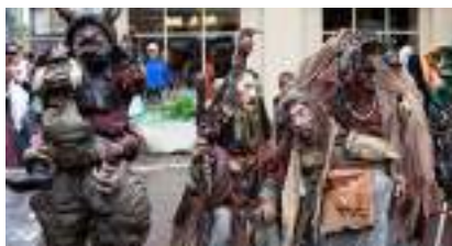
Monstrueux TROLLS : Créatures des Jeux de Trônes, Donjons, Dragons et Héroïc Fantasy