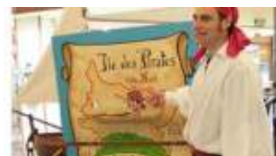
LE TRESOR DU PIRATE : chariot spectacle pour jeux d'aventure