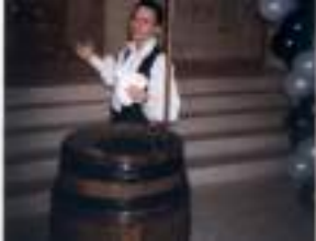
CAPITAINE MAGIQUE et son tonneau: cartes atout coeur de pirate!