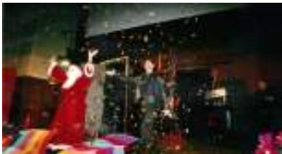
Spectacle de Magie pour Arbre de Noël : MARC LE MAGICIEN INTENSE