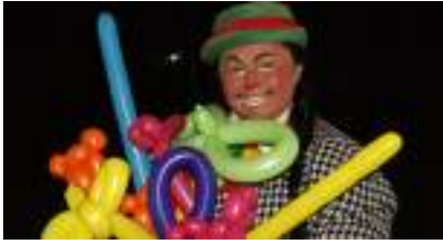
CLOWN ou MAGICIEN : Artiste du Cirque à fond les Ballons compte Double !