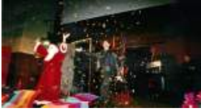
Spectacle de Magie pour Arbre de Noël : MARC LE MAGICIEN INTENSE