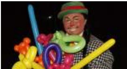
CLOWN ou MAGICIEN : Artiste du Cirque à fond les Ballons compte Double !