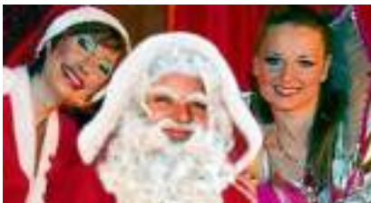
LA LEGENDE DU PERE NOEL