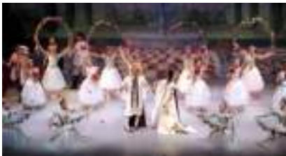
LA BELLE AU BOIS DORMANT: musique de Tchaïkovski conte de Perrault et Grimm