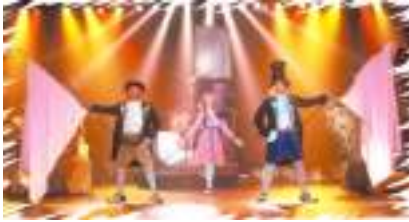
CONTE MUSICAL FEERIQUE SNIAC