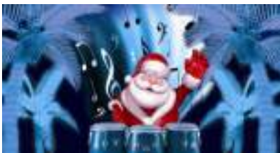
SPECTACLE de NOEL Musical Familial et Féérique : CIRCUS BONGO PARADE !