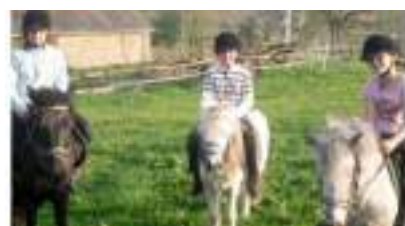
PONEYS en LOCATION pour BALADES