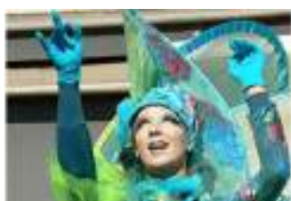
LES FLEURS SUR ECHASSES : Bouquet de Femmes Végétales au Parfum