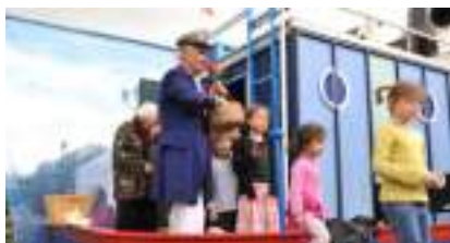
LES CONTES A L'EAU Les enfants de la Marine