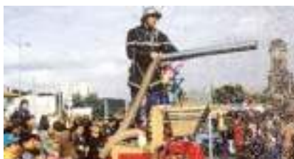
CHAR DES POMPIERS CONFETTIS