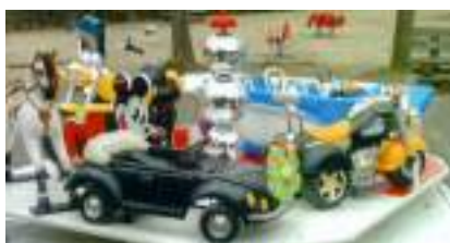
PETIT MANEGE ECOLO