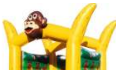
CHATEAU GONFLABLE SINGE