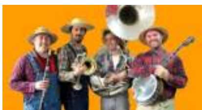
JAZZ AU NATUREL : l' Orchestre des Jardiniers des Campagnes à la Main Verte