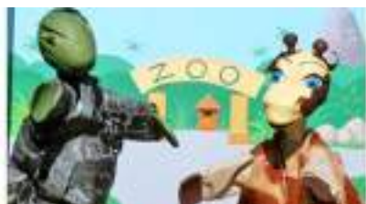
Spectacle de GUIGNOL et les Animaux du ZOO