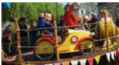
LE MANEGE ECOLO VELO RIGOLO et ARTISANAL