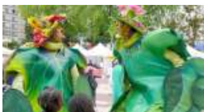
ECHASSIERS VERTS ENCHANTES : accueil écolo-clown oxygéné