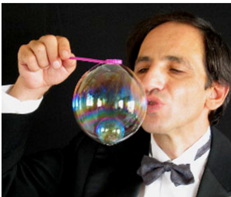
Loto (1 bulle de 20 cm avec à l'intérieur 20 bulles qui tournent)