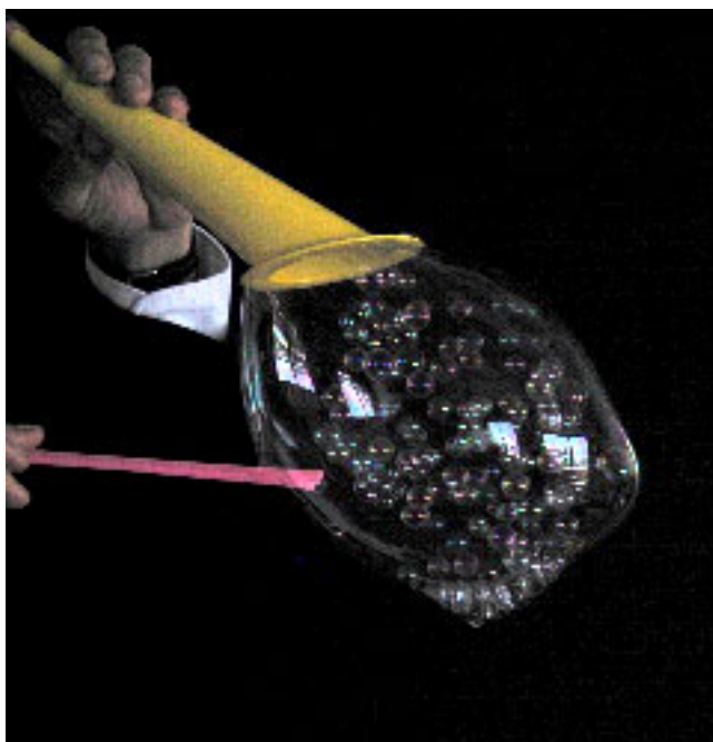
Chenille (bulles collées en chenille)