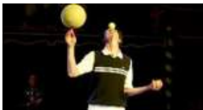
Drôle de Tennis : BALLES RAQUETTES ET JONGLE