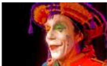
L'AUTOMATE A GAGS : entre mime, pantomime et robot