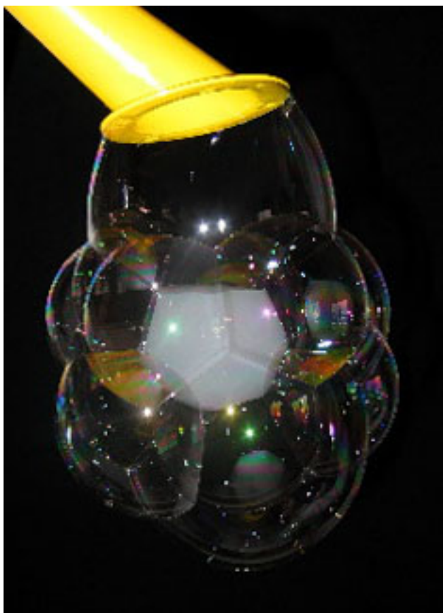
Grand kangourou (1 bulle de 40 cm dans laquelle on met des bulles de 5 cm)

Published on Monica Médias ( https://www.monicamedias.com )