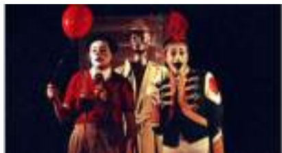
LES PARTOUPAREILS : cirque burlesque en déambulation