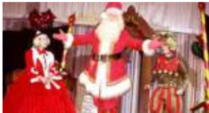
NOËL EN FAMILLE: père, mère, lutins, jouets et poupées