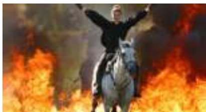
LE WESTERN FAIT SON CINEMA Dressage et Acrobaties

Source URL: https://www.monicamedias.com/les-stars-de-cinema.html