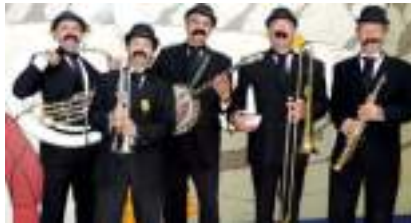
L'Orchestre Rétro de la Belle Époque et des Années Folles 1900-1920