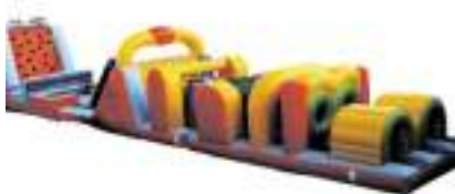
SUPER DEFI GONFLABLE