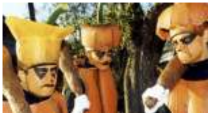
Chansons Halloween et Cucurbitacées Costumées : OUILLE LES CITROUILLES !