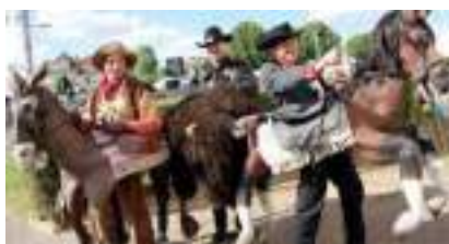
BALADE AU FAR WEST : duel pour bison et shérif