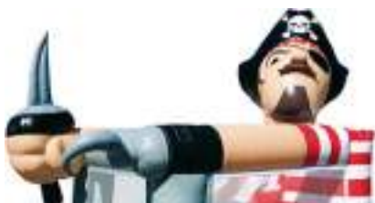
PIRATE GONFLABLE ASSIS avec TOBOGGAN