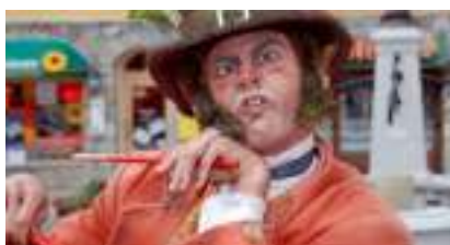
LES COMEDIENS FANTASMAGORIQUES : Fous d'Impro et Farceurs du Cirque Fantastique