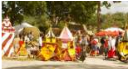
Le Petit Camp Médiéval des Beaux Jeux : LE VILLAGE DES CHERUBINS