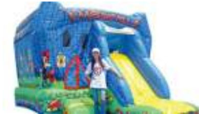
CHATEAU MEDIEVAL GONFLABLE