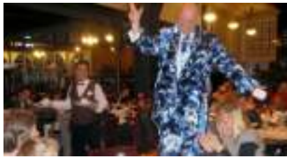
LES ECHASSIERS MAGICIENS : trucs géants XXL