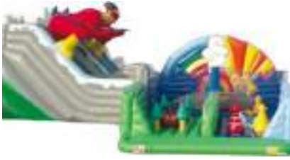
EXTREME GLISSE GONFLABLE