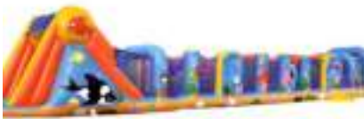
OCEAN GEANT GONFLABLE

Source URL: https://www.monicamedias.com/defi-arches-gonflables.html