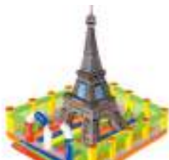
TOUR EIFFEL GONFLABLE