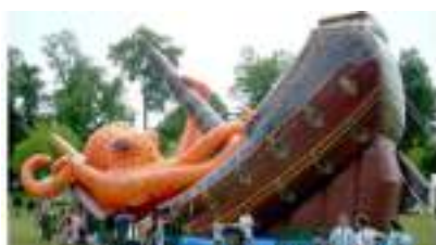
TOBOGGAN du GALION à la PIEUVRE GEANTE GONFLABLE