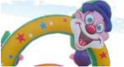
JOYEUX CIRQUE GONFLABLE