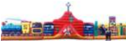
GRAND CANYON GONFLABLE