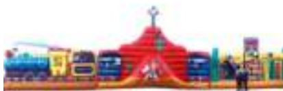
GRAND CANYON GONFLABLE