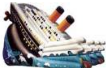
TOBOGGAN TITANIC GONFLABLE